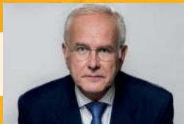
Harald Schmidt Samstag. 14. März. 20 Uhr.