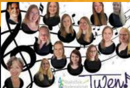
Best of Twen! - 10 Jahre Frauenpower Sonntag. 19. April. 17 Uhr.